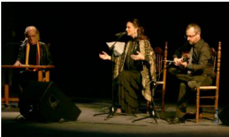
Luis Eduardo Aute y Marina Heredia sobre el escenario del Infanta Leonor

Un recital de poesía y canto a cargo de Luis Eduardo Aute y Marina Heredia Festival de Otoño 2013 (Jaén)